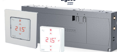
Danfoss Icon2™ Hauptregler Danfoss Icon2™ Raumthermostate*